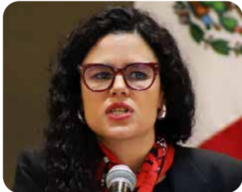
María Luisa Alcalde