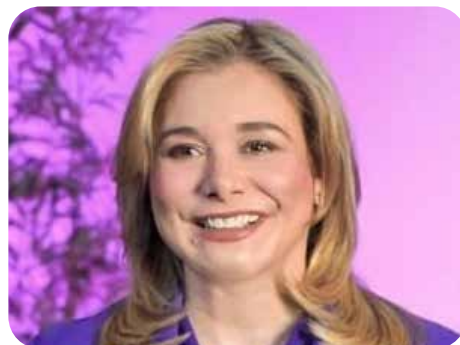
María Eugenia Campos