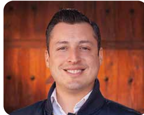
Luis Donald Colosio Riojas