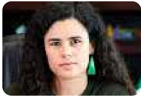
Luisa María Alcalde

Después de muchos rumores tanto de la oposición como de la militancia del propio partido de Morena, pues siempre se dijo que su dirigente nacional LUISA MARÍA ALCALDE LUJÁN, no tenía un panorama limpio y que solo representaba una cercana relación familiar entre ANDRÉS MANUEL LÓPEZ OBRADOR y su madre BERTHA LUJÁN, quien fue la presidenta del consejo de este partido.