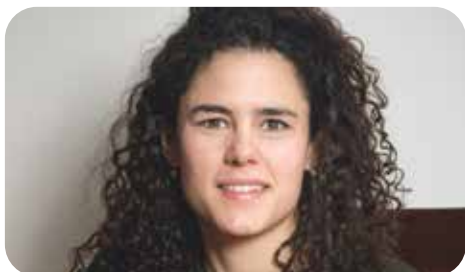
Luisa María Alcalde